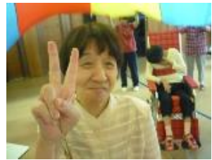
コしどうなっとる!!