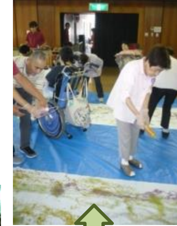
アート活動(松クラブ)の様子